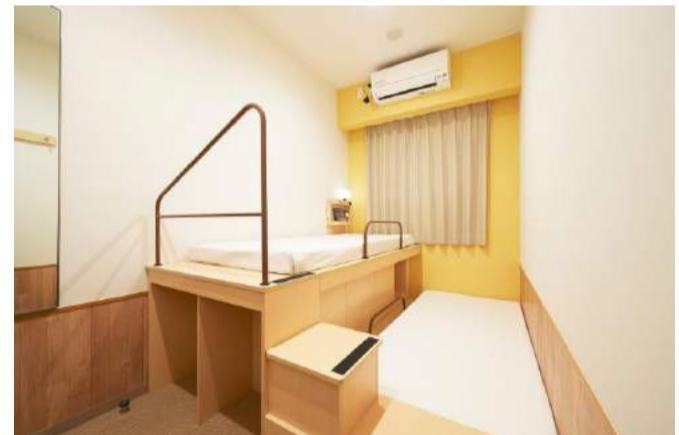
客室 [ステップツイン] (特許出願中：特願2018-8676) SOTETSU×西川リビング オリジナル「クラウドィキューブ」マットで 快眠をご提供。